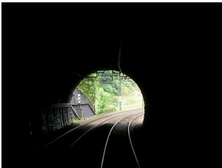
La sortie vue de l'intérieur

Si cette fiche comporte des erreurs ou des oublis, merci de nous le signaler.