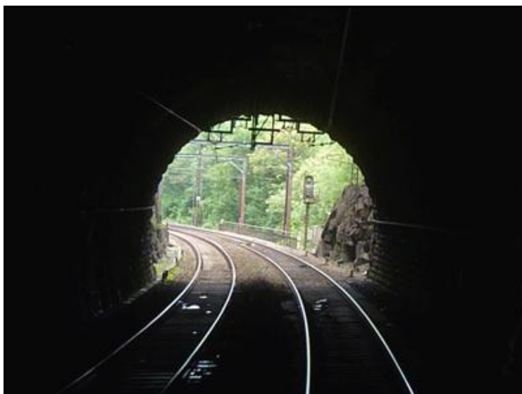
La sortie vue de l'intérieur

Si cette fiche comporte des erreurs ou des oublis, merci de nous le signaler.