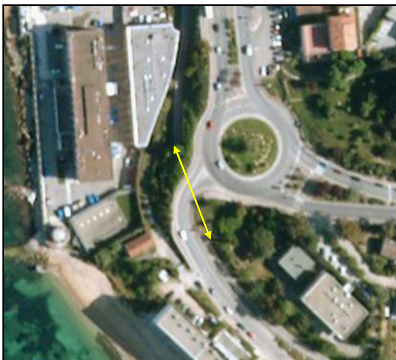
Vue aérienne de la galerie d'Aspetto Bis

Si cette fiche comporte des erreurs ou des oublis, merci de nous le signaler.