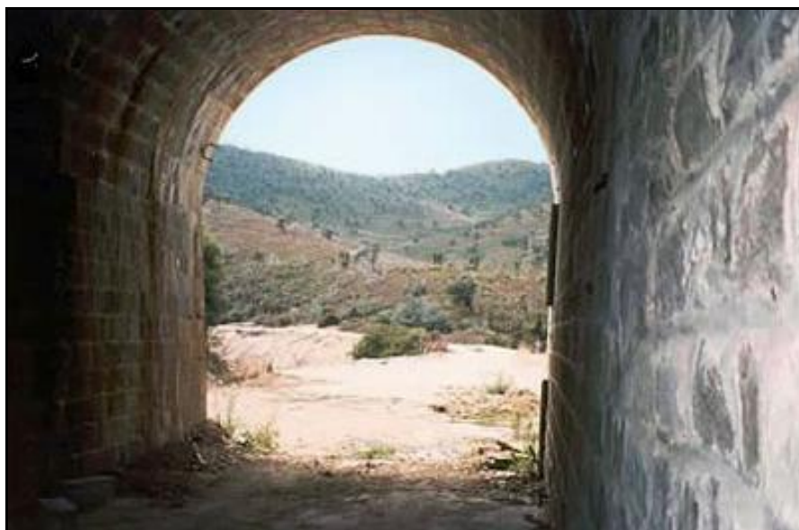
La sortie vue de l'intérieur