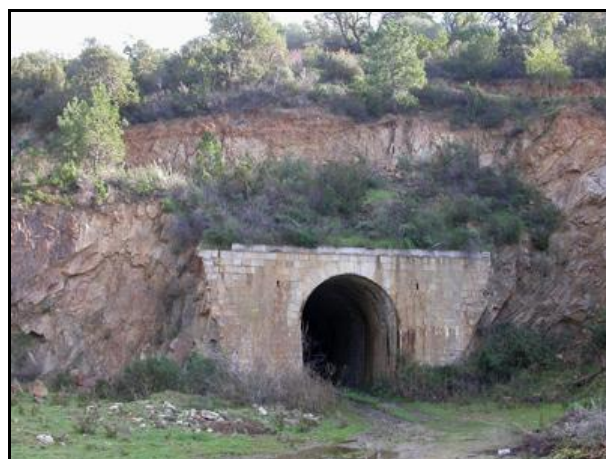
Dans le lointain, l'entrée du tunnel