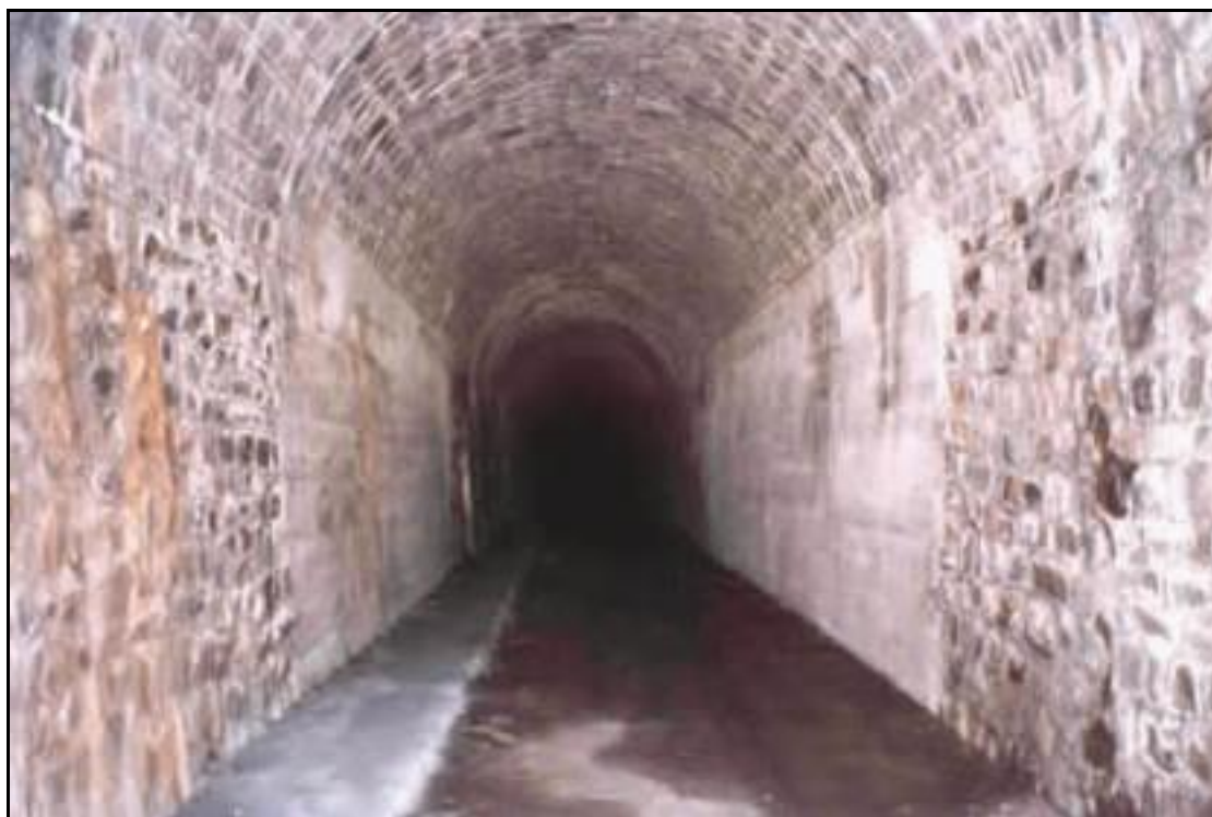
La galerie dans sa partie sud

Si cette fiche comporte des erreurs ou des oublis, merci de nous le signaler.