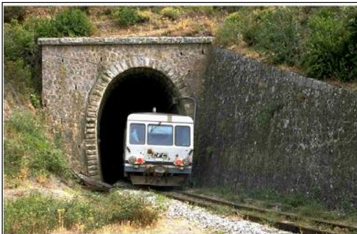
Un autorail à destination de Ponte Leccia s'engouffre dans la sortie du tunnel

Si cette fiche comporte des erreurs ou des oublis, merci de nous le signaler.