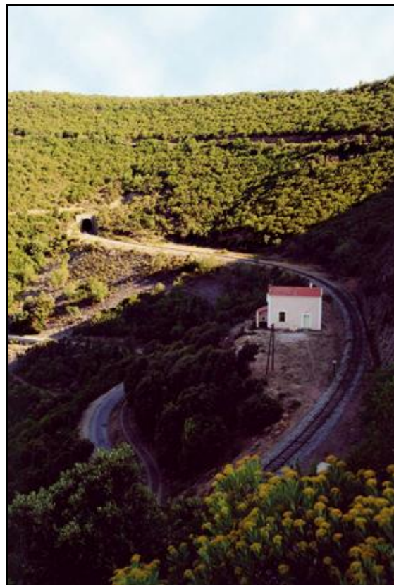
L'entrée et la sortie du tunnel