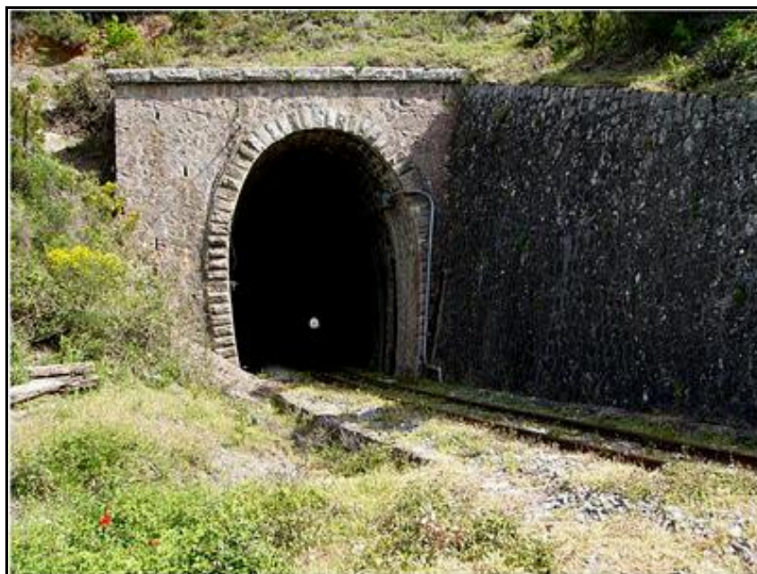
La sortie du tunnel

Quelqu'un a pris mon derrière. Qui prendra mon visage ?