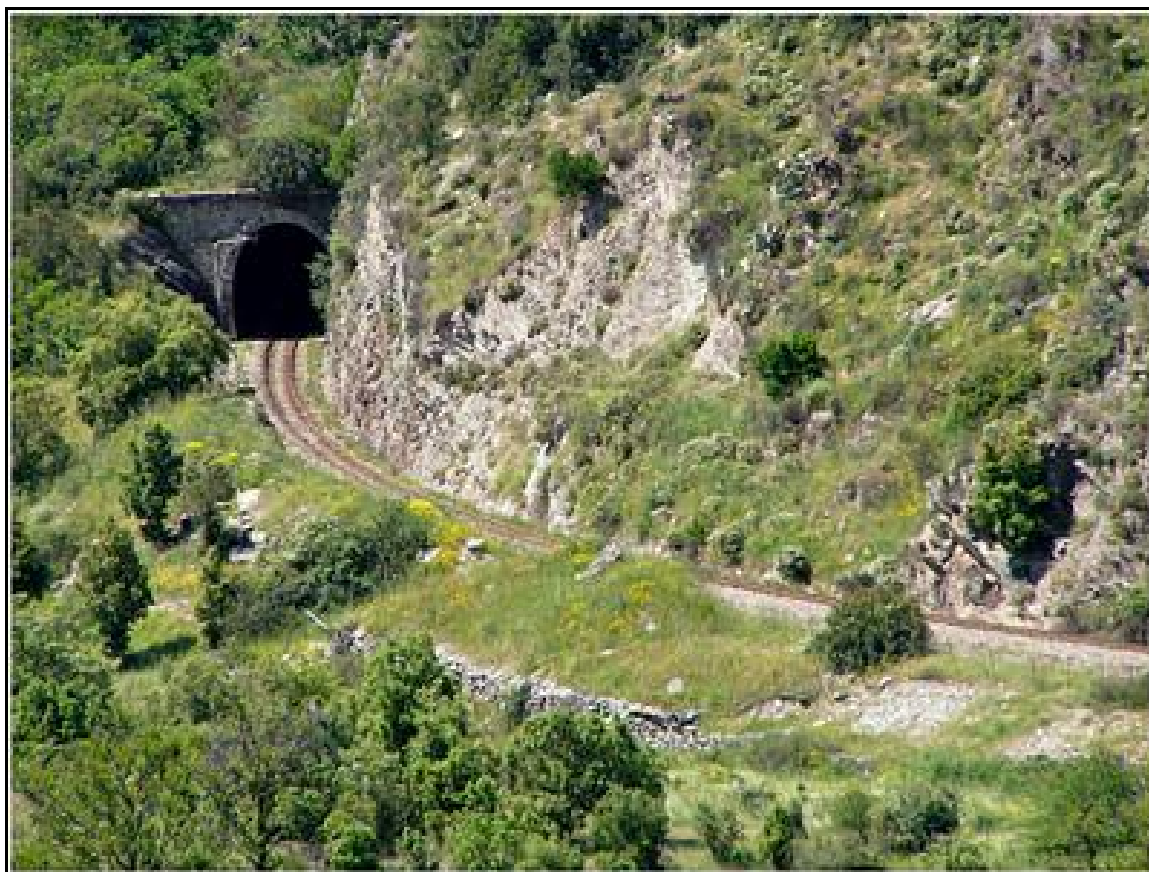
Ci-dessus et ci-dessous, autres vues de l'entrée du tunnel