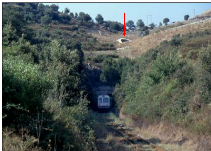
Un autorail s'engage dans la sortie tunnel La flèche indique la sortie sud du tunnel routier de San Quilico

Si cette fiche comporte des erreurs ou des oublis, merci de nous le signaler.