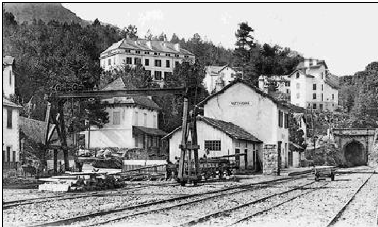
Hier et aujourd'hui : la gare de Vizzavona et l'entrée du tunnel