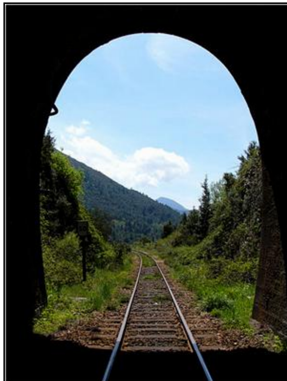
L'entrée et la sortie du tunnel vues depuis la galerie

Sur la photo de gauche, au sommet de la voûte, l'antenne radio pour communiquer avec les trains