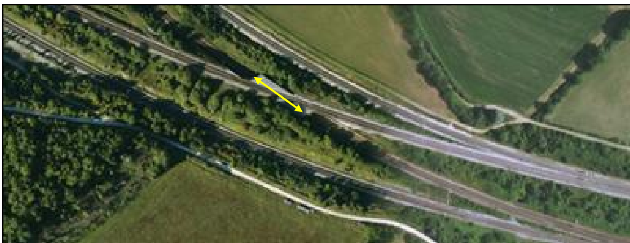
Vue aérienne du saut de mouton

Si cette fiche comporte des erreurs ou des oublis, merci de nous le signaler.