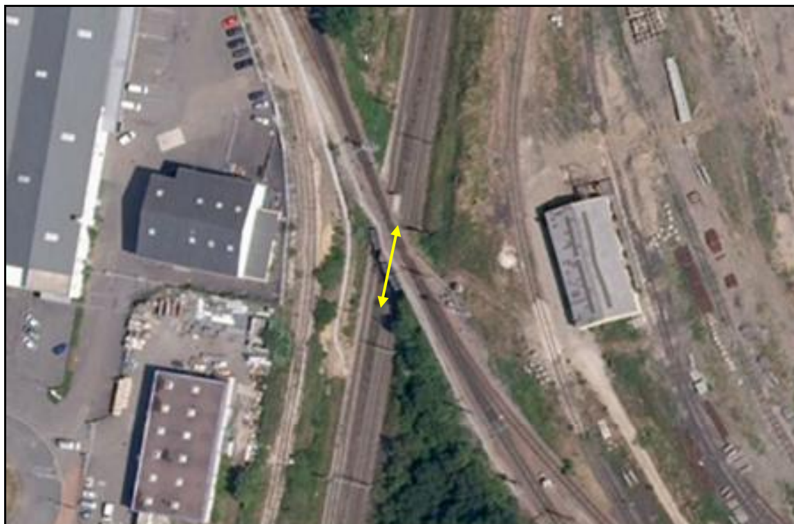
Vue aérienne du saut de mouton

Quelqu'un a pris mon derrière. Qui prendra mon visage ?