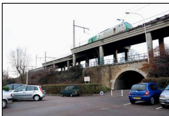
Deux vues latérales du saut de mouton photographié par son côté gauche