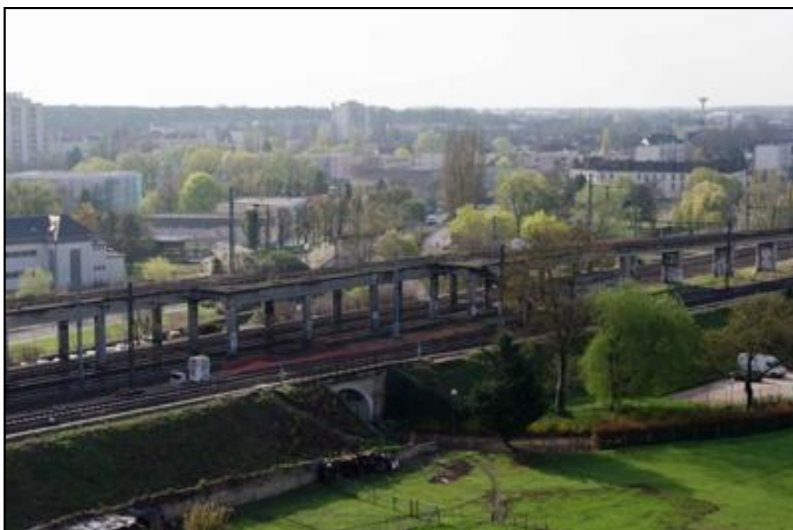
Ci-dessus et ci-dessous, deux autres vues latérales prises cette fois du côté droit La gare de Dijon est ici vers la gauche