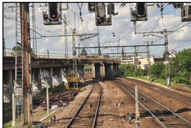
L'entrée vue depuis l'intérieur de la galerie