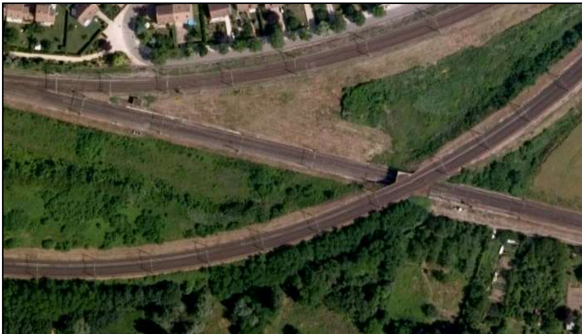
Vue aérienne de cette courte galerie

Si cette fiche comporte des erreurs ou des oublis, merci de nous le signaler.