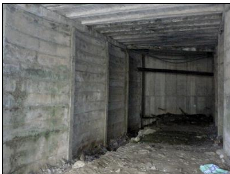
Ci-dessus et ci-dessous, détail de construction de la galerie, de ses pénétrations et de son toit