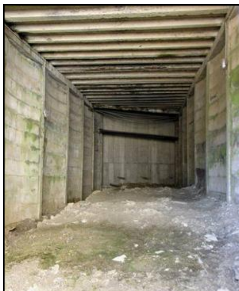
La curieuse galerie construite avec des éléments en béton armé préfabriqués