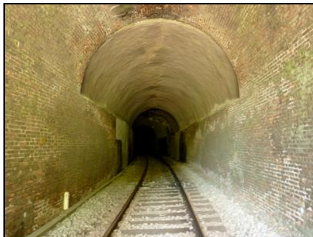
La galerie vue depuis l'entrée et la sortie

Si cette fiche comporte des erreurs ou des oublis, merci de nous le signaler.