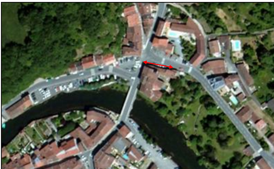
Vue aérienne de l'emplacement de la galerie

Si cette fiche comporte des erreurs ou des oublis, merci de nous le signaler.