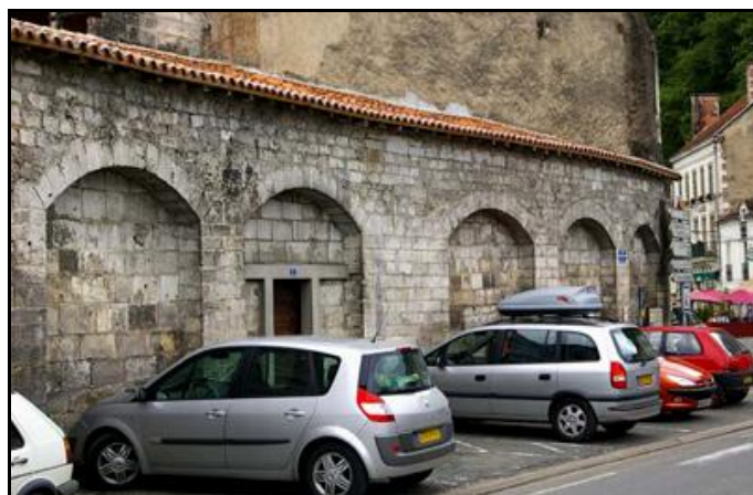
Les arcades internes du piédroit gauche

Ci-dessus et ci-dessous, la place de la gare Les maisons qui comportaient le tunnel ont été rasées Seul le piédroit gauche du tunnel ( flèche ) a survécu L'amorce de la voûte est encore visible