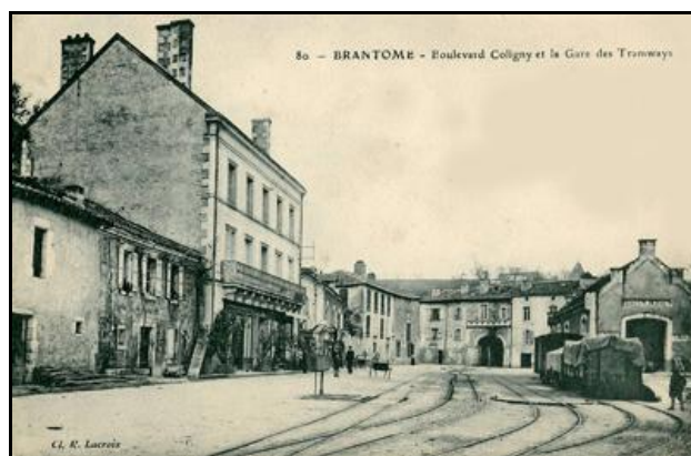
Et sa sortie au fond de la place de la gare