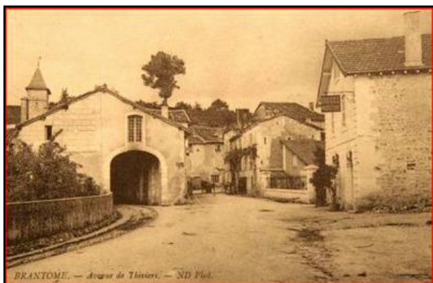
L'entrée du tunnel dans la maison à gauche