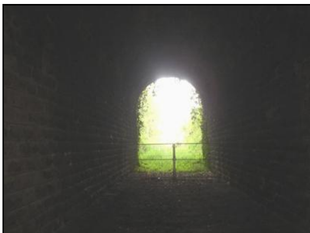
L'entrée vue de l'intérieur

Si cette fiche comporte des erreurs ou des oublis, merci de nous le signaler.