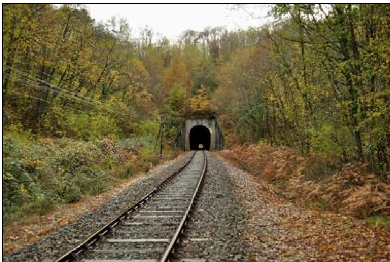
Autre vue de la sortie montrant la variation de pente de la voie dans le tunnel

Si cette fiche comporte des erreurs ou des oublis, merci de nous le signaler.