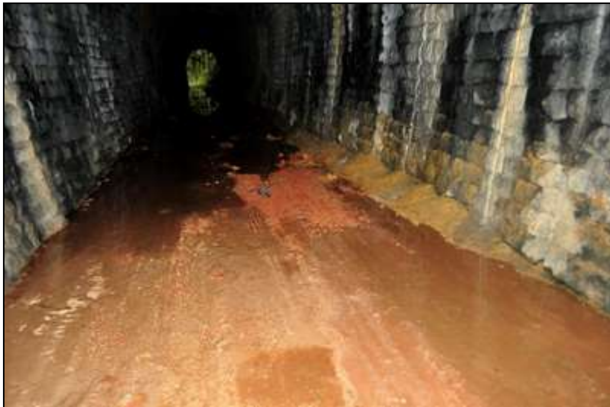
Le radier inondé par les eaux d'infiltration et les piédroits envahis par diverses coulées calcaires ou ferrugineuses