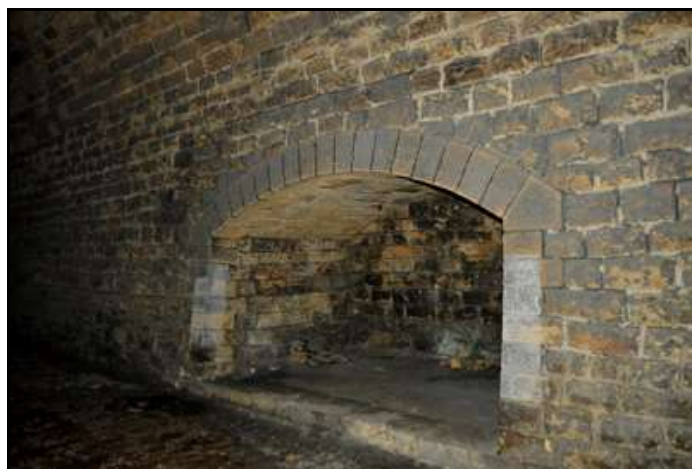
Une niche abri particulièrement généreuse