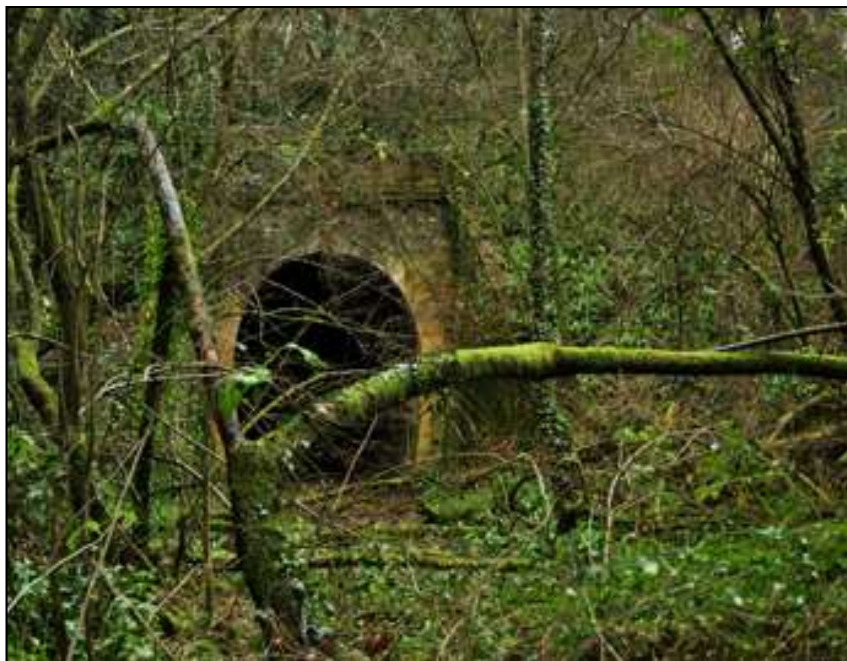
Autre photo de l'entrée du tunnel perdue dans la verdure

Sur la photo ci-contre, l'entrée du tunnel est à 50 m, droit devant.