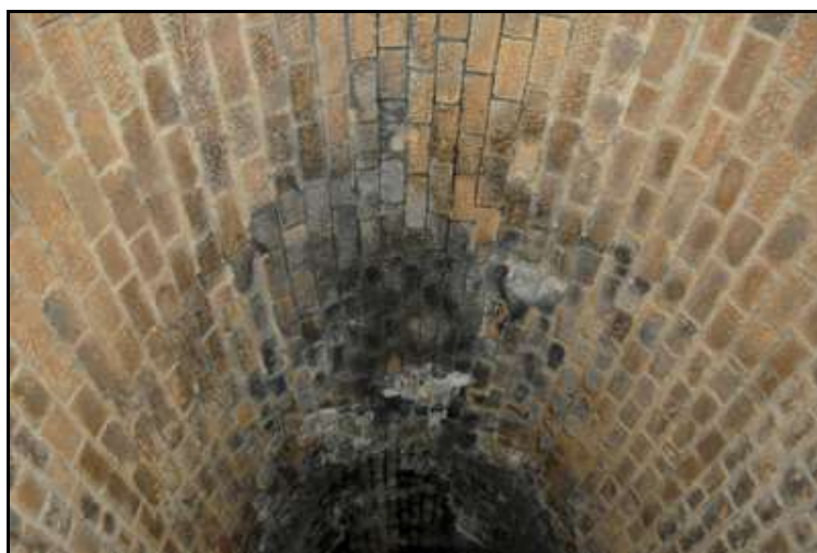
Une voûte dans l'ensemble bien conservée et en bel appareil