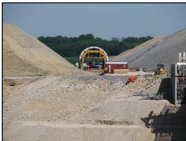
Ci-dessus et ci-dessous, la galerie à divers stades de sa construction