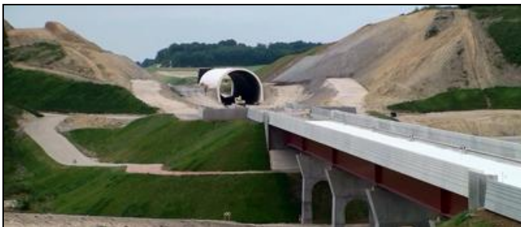
Ci-dessus et ci-dessous, la sortie de la tranchée couverte en construction