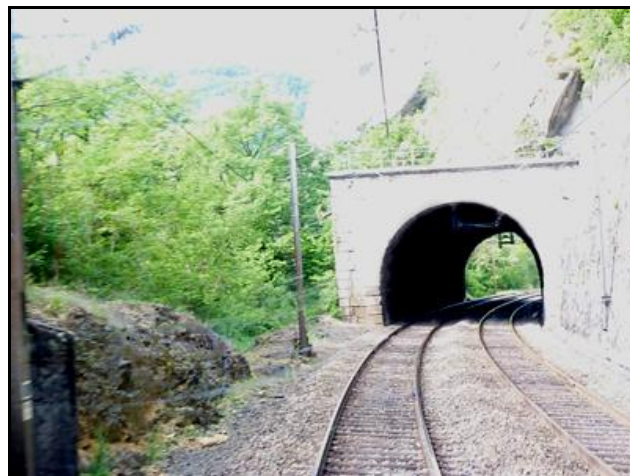
Sortie du tunnel photographiée depuis l'entrée du souterrain de la Grange Ravey 2