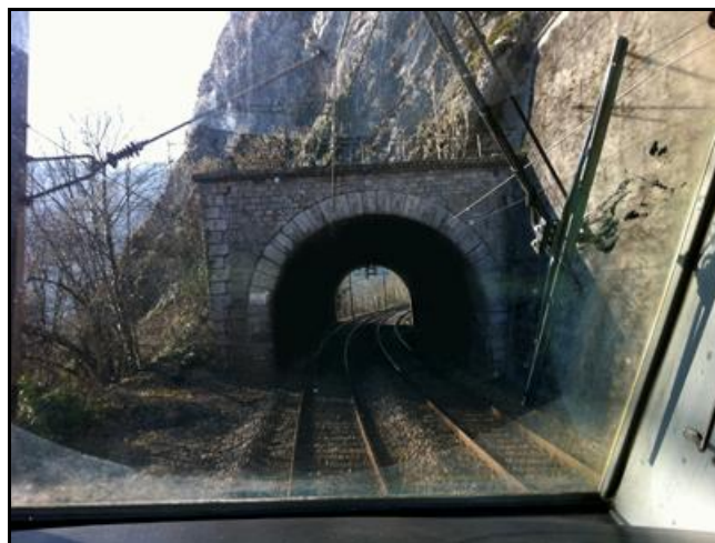
A l'arrière-plan, l'entrée du tunnel de la Grange Ravey 2