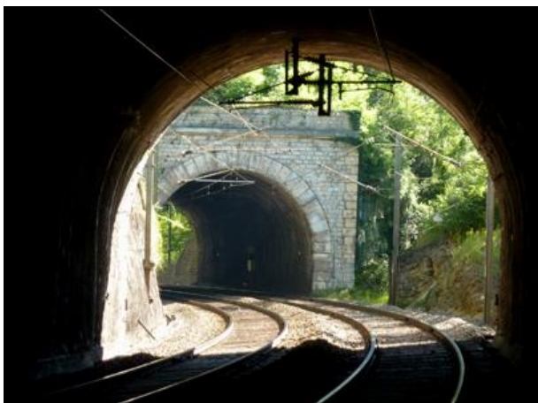
L'entrée du tunnel prise à travers la galerie du tunnel de la Grange Ravey 1