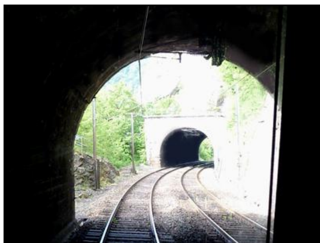
L'entrée vue de l'intérieur avec le tunnel de Grange Ravey 1