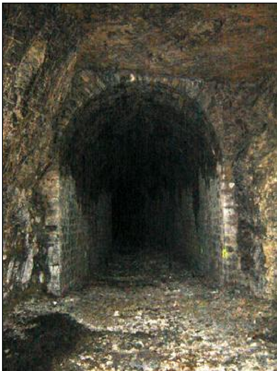
Le raccord entre la partie maçonnée de l'entrée et la galerie en roche vive qui lui fait suite La strate calcaire qui forme voûte est bien visible