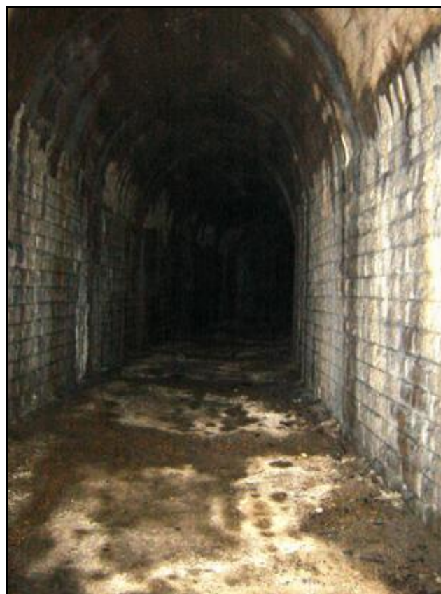
La fin maçonnée de la galerie avec sa voûte en béton armé suite aux dégâts de guerre