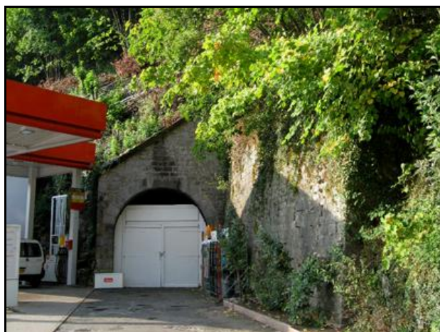
L'entrée fermée dans la station service