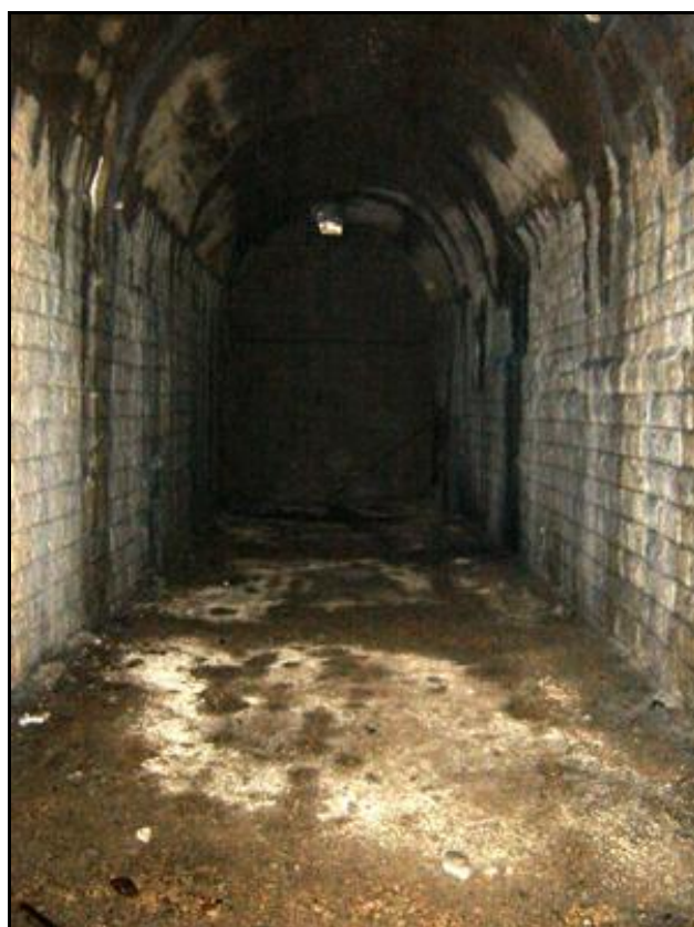
La sortie murée vue de l'intérieur

Si cette fiche comporte des erreurs ou des oublis, merci de nous le signaler.