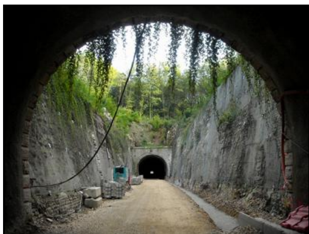
L'entrée vue depuis le tunnel de Saint Claude 3