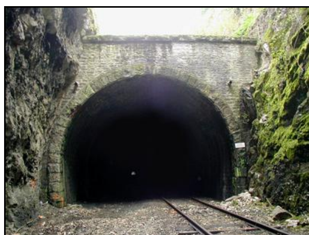
Ci-dessus et ci-dessous, l'entrée et la sortie du tunnel dans leur état primitif, avant travaux de réfection