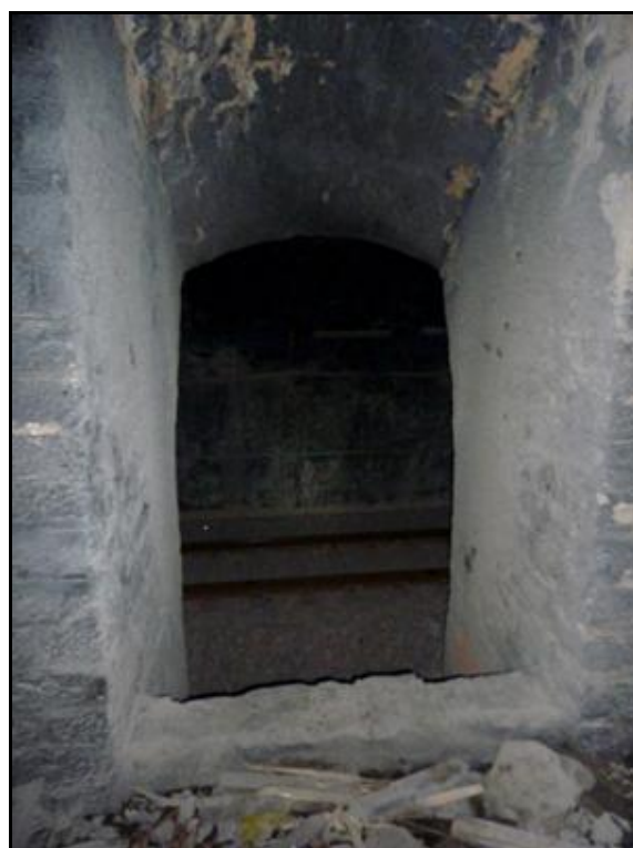
L'accès à la cheminée d'aération vu depuis le tunnel et de dessous la cheminée