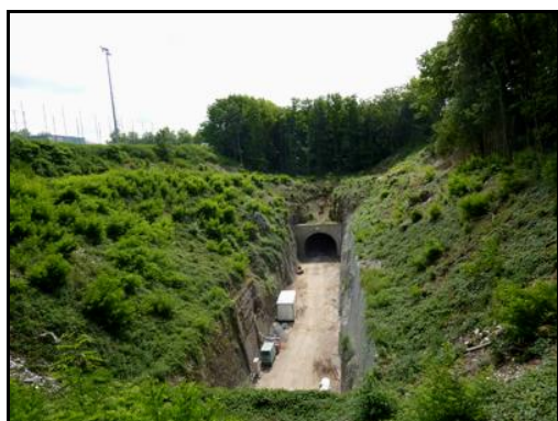
Ci-contre et ci-dessous, l'entrée et la sortie du tunnel pendant les travaux de reconditionnement