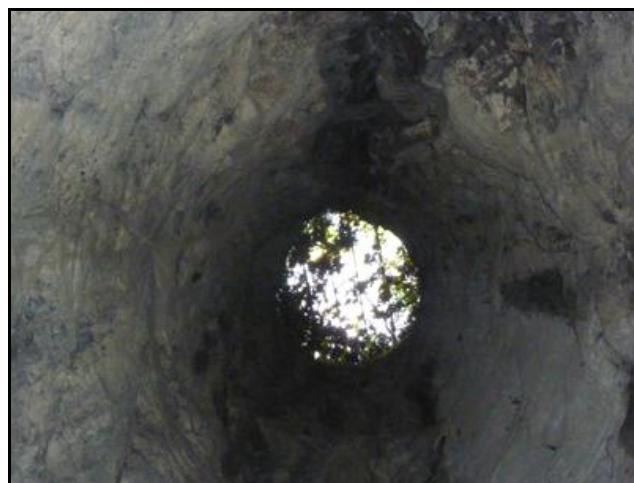
La cheminée taillée directement dans la roche brute, vue de dessous