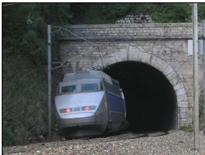
Ci-dessus et ci-dessous, trains à l'entrée du tunnel