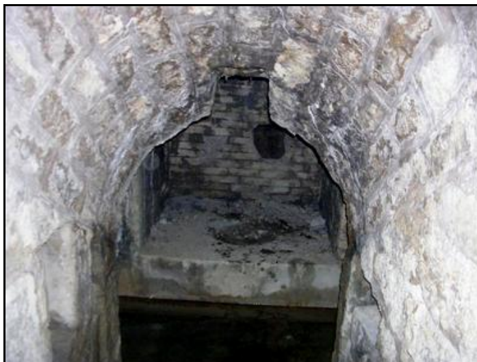
Le fourneau de mine

Si cette fiche comporte des erreurs ou des oublis, merci de nous le signaler.