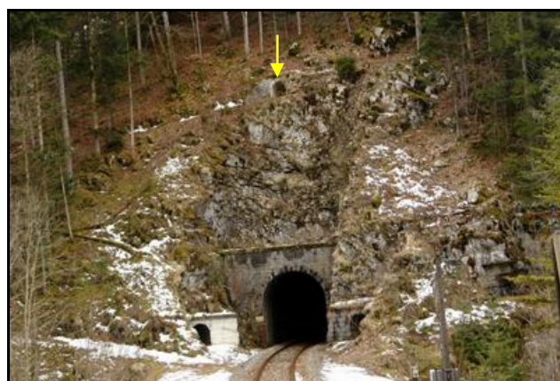
La sortie avec, au-dessus, l'accès au fourneau de ciel