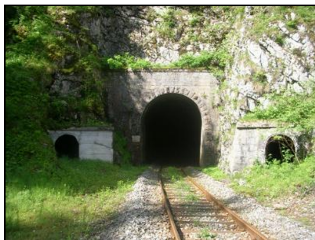
Les orifices du tunnel avec leurs fourneaux de minage latéraux