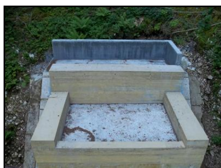
Ci-contre, détail du dessus du nouveau fronton d'entrée du tunnel