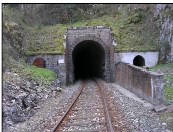
L'entrée avant réfection