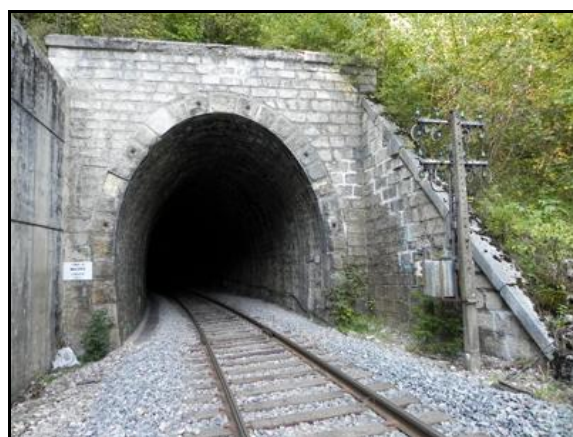
L'entrée et la sortie du tunnel après campagne de travaux de réfection