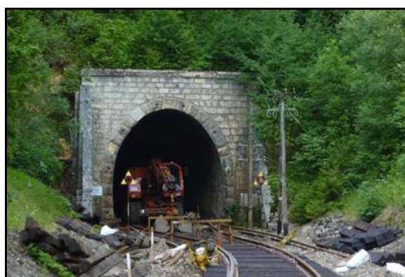
Ci-dessus et ci-dessous, l'entrée et la sortie du tunnel pendant les travaux