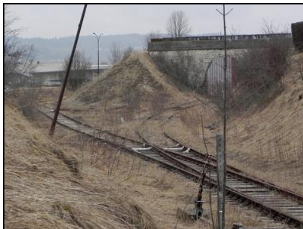
L'entrée du tunnel désaffecté avant reprise par l'association et pose des portes