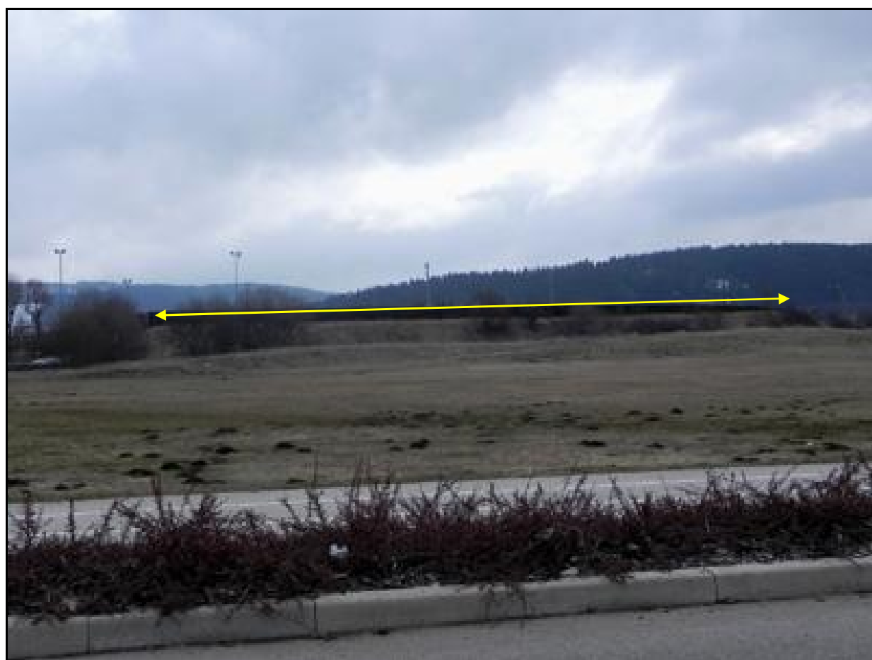
La butte de protection constituée par le remblai rapporté au-dessus du tunnel

Si cette fiche comporte des erreurs ou des oublis, merci de nous le signaler.