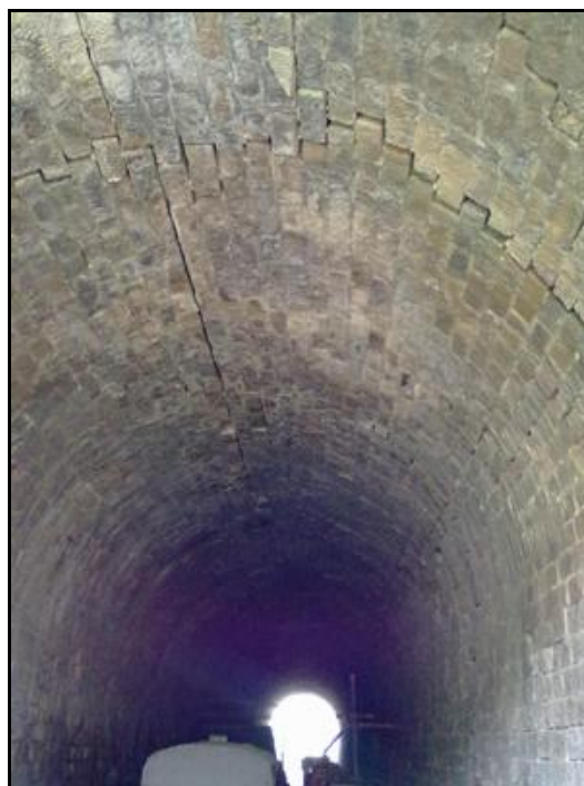
Ci-dessus et ci-dessous, divers aspects de la galerie en état de rupture imminente