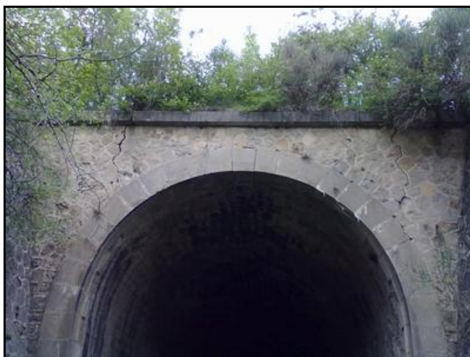
Ci-dessus et ci-dessous, état de dislocation des deux frontons d'entrée et sortie