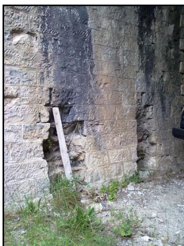
Ci-dessous, des entailles ont été creusées dans la base des pénétrants pour tenter de placer des cintres métalliques de soutien, mais cette formule n'offrait pas une sécurité suffisante