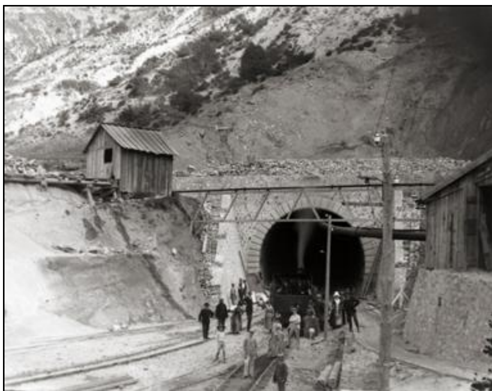
La sortie du tunnel, à l'époque des travaux de creusement

Si cette fiche comporte des erreurs ou des oublis, merci de nous le signaler.