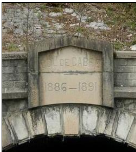
Le cartouche de construction qui surmonte le fronton de sortie