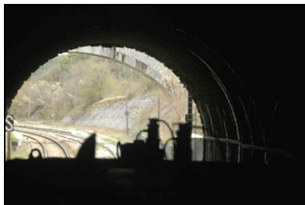
L'entrée et la sortie du tunnel vues de l'intérieur