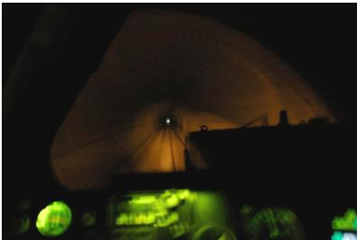
Aux commandes d'une machine, dans la longue galerie