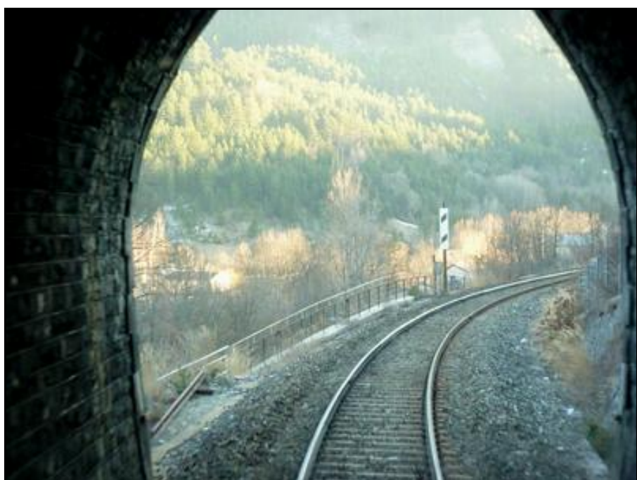
L'entrée vue de l'intérieur

Si cette fiche comporte des erreurs ou des oublis, merci de nous le signaler.