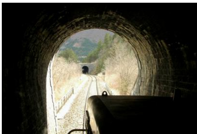
A l'arrière-plan, la sortie de la galerie des Blaches