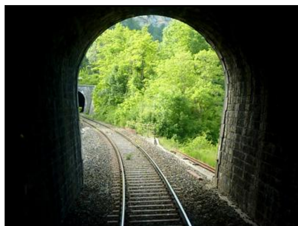
Et l'entrée de la galerie Cascade 2

Si cette fiche comporte des erreurs ou des oublis, merci de nous le signaler.