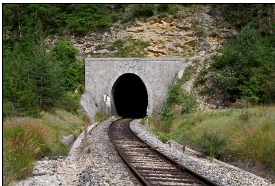
L'entrée du tunnel avant l'installation des glissières pour éviter les chutes de blocs

Si cette fiche comporte des erreurs ou des oublis, merci de nous le signaler.