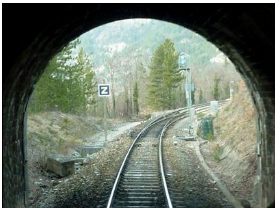
L'entrée vue de l'intérieur

Si cette fiche comporte des erreurs ou des oublis, merci de nous le signaler.