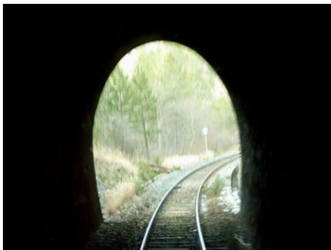
L'entrée du tunnel vue de l'intérieur

Si cette fiche comporte des erreurs ou des oublis, merci de nous le signaler.