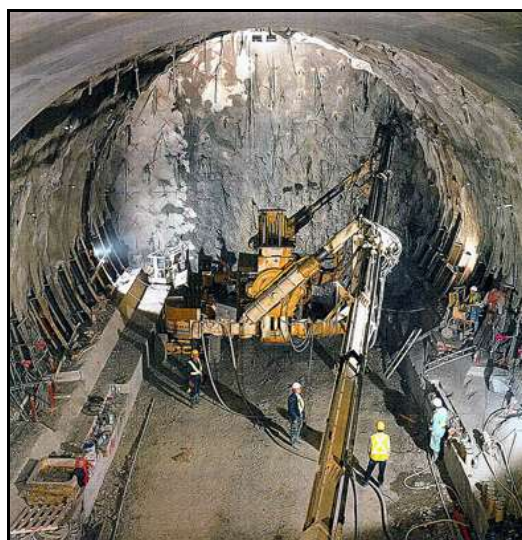
Deux vues des travaux de creusement de la galerie