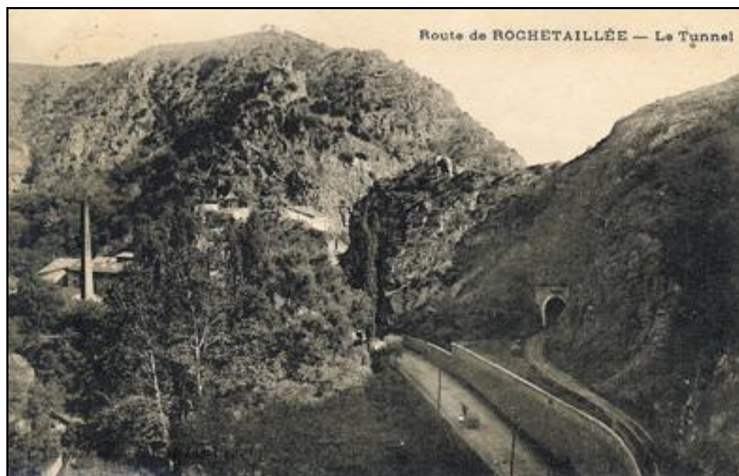
L'entrée du tunnel de Rochetaillée du temps de la ligne métrique

Si cette fiche comporte des erreurs ou des oublis, merci de nous le signaler.