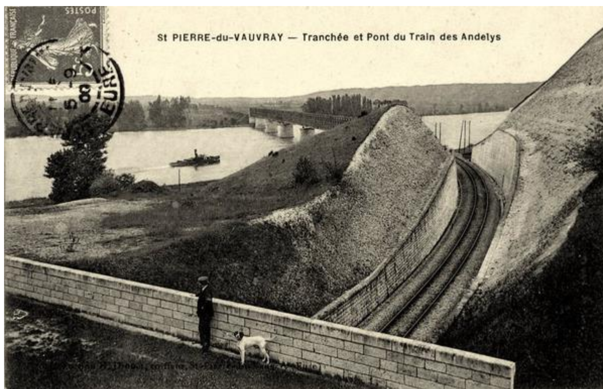
Très belle carte postale ancienne prise depuis le haut de la sortie de tunnel montrant la profonde tranchée qui suit le tunnel et le viaduc sur la Seine.