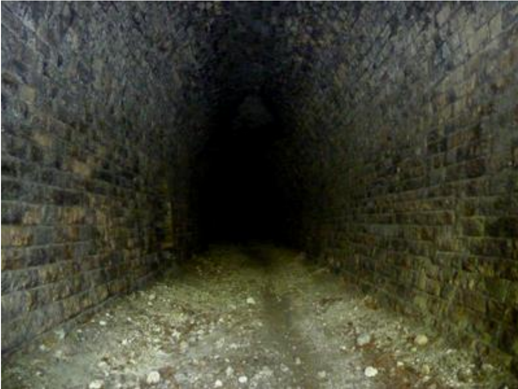
Vue en direction de la sortie