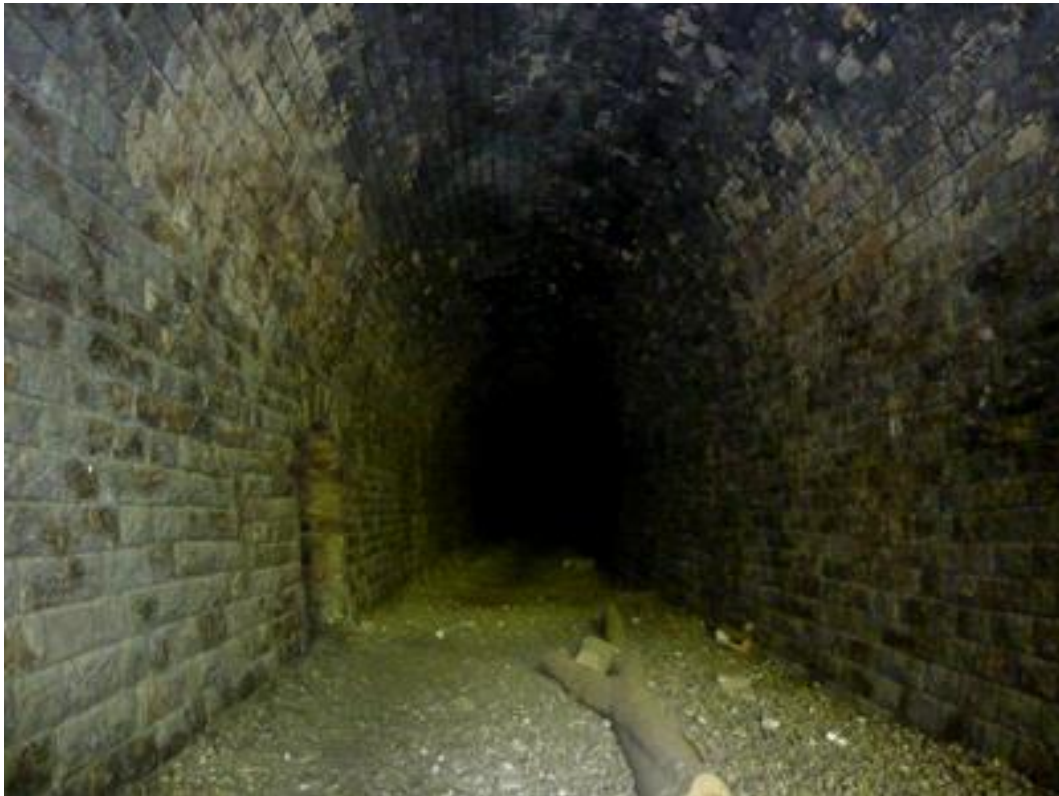
Vue en direction de l'entrée