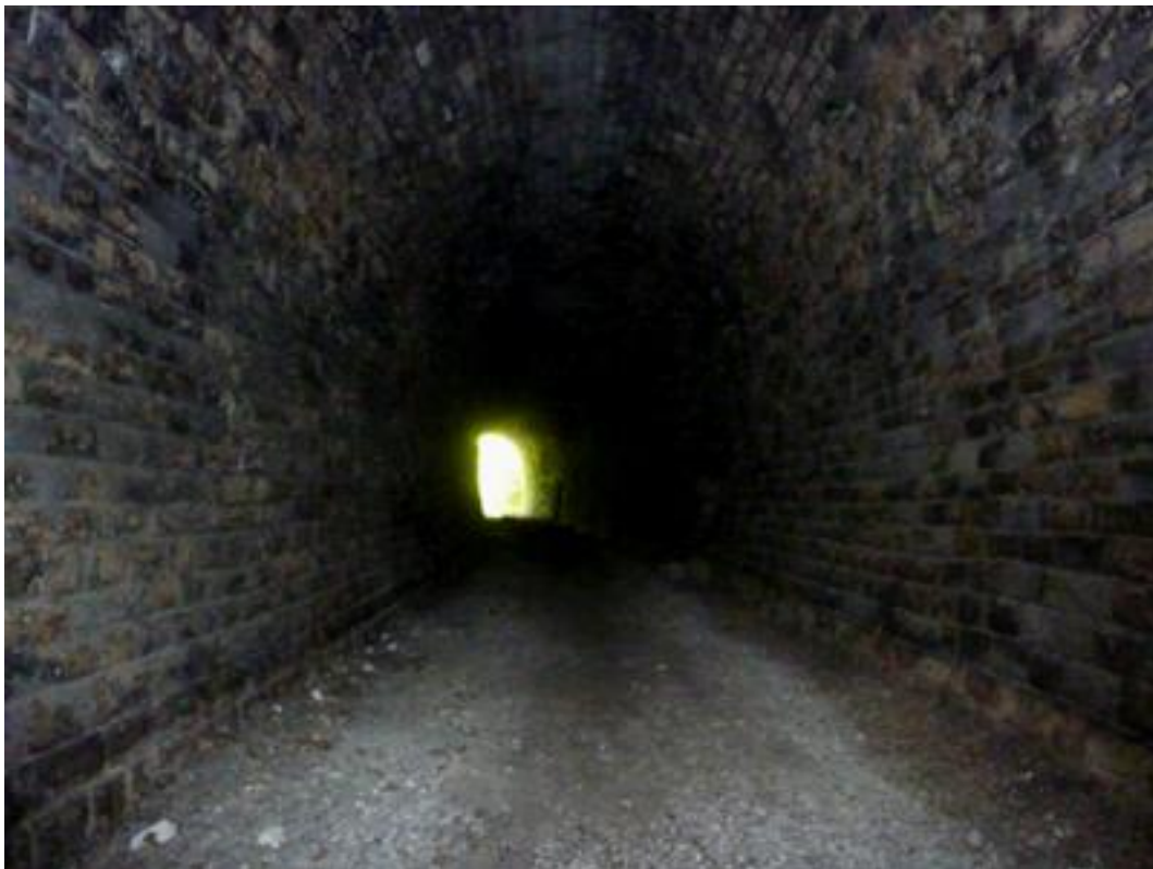
Vue en direction de la sortie