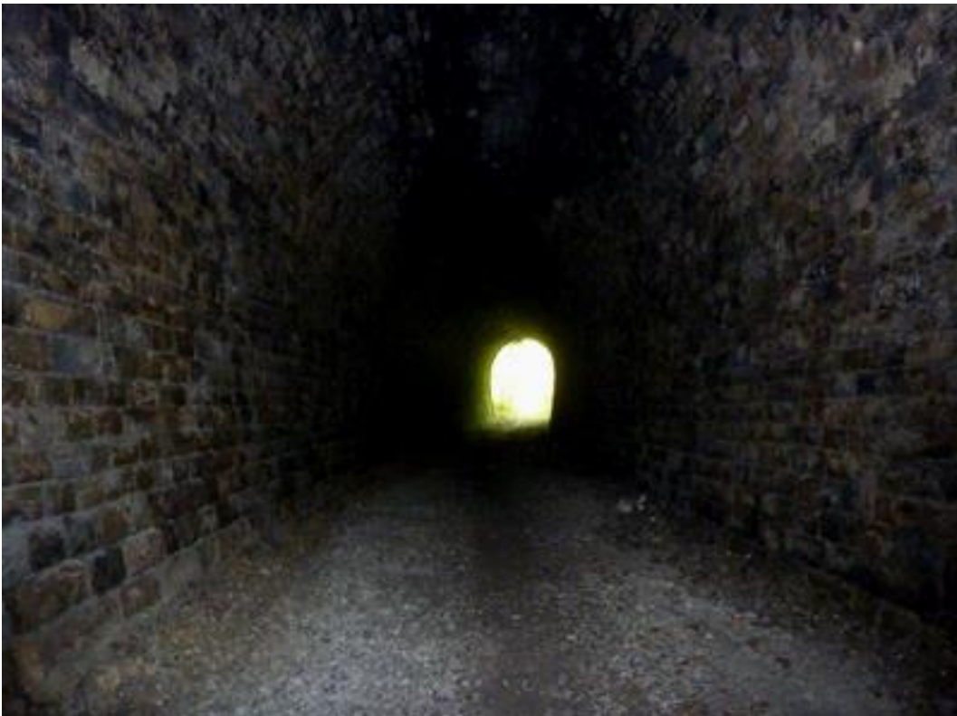
Vue en direction de l'entrée