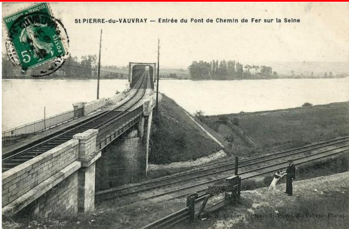
Passage de la ligne vers Les Andelys au-dessus de la ligne de Paris-Saint-Lazare au Havre