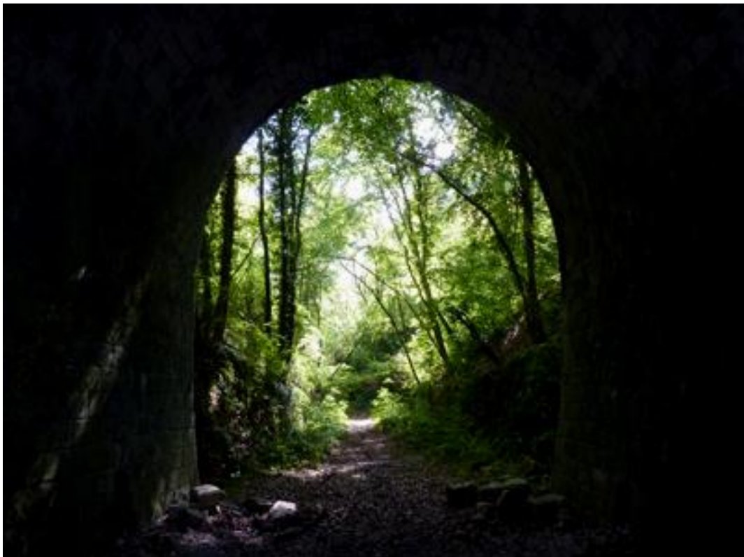
La sortie vue depuis l'intérieur du tunnel