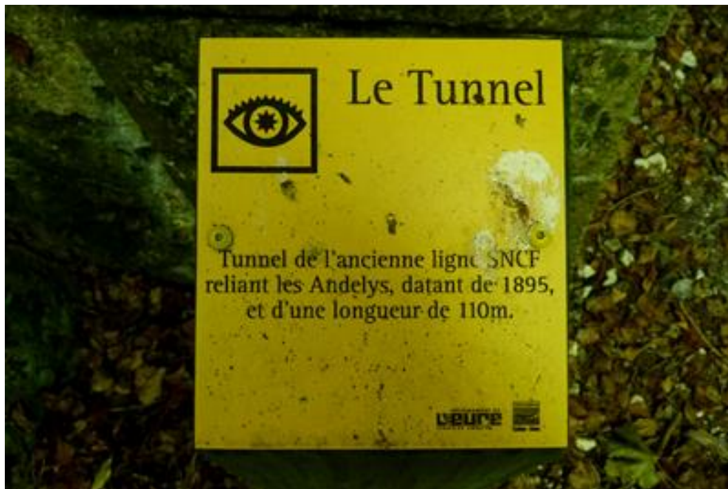
Pancarte informative sur le tunnel du temps où il était traversé par un chemin de randonnée.