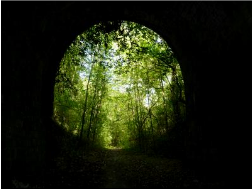
Vue de l'entrée depuis l'intérieur du tunnel