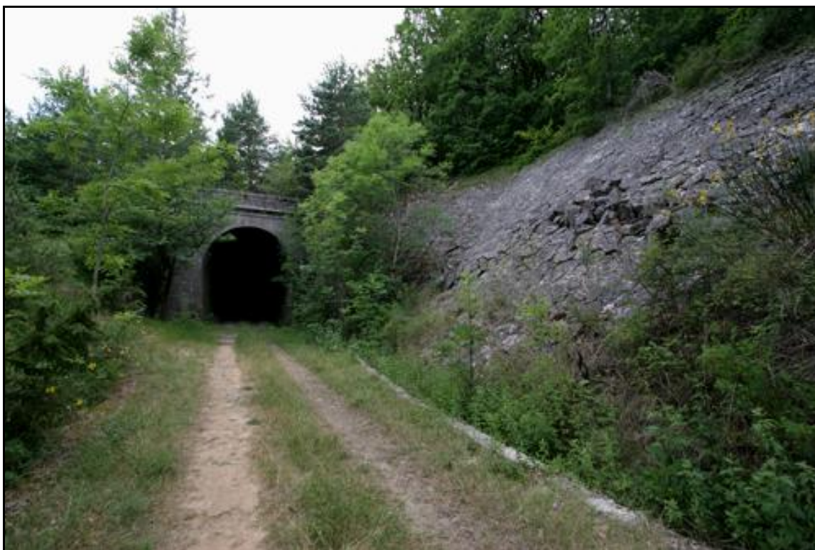
La sortie du tunnel et le parement de la tranchée en train de se disloquer sous les poussées de terrain