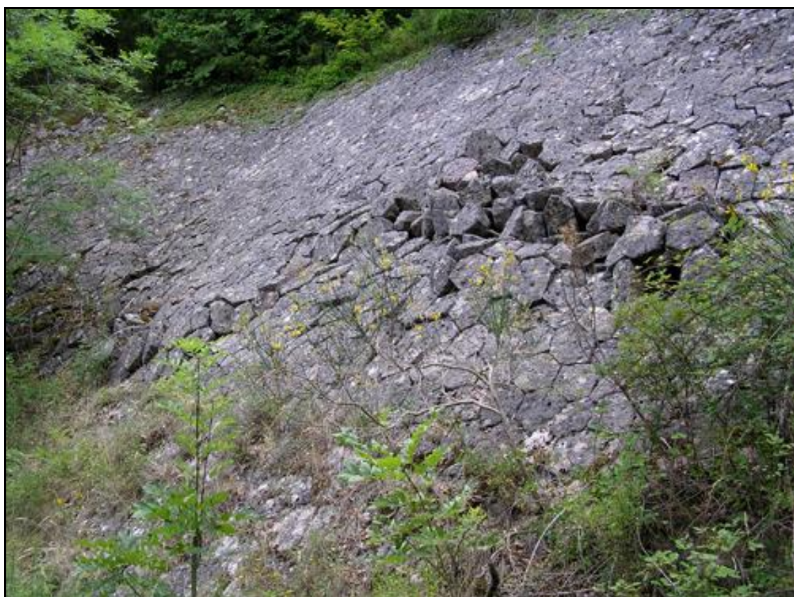
Gros plan sur les contraintes subies par le parement en pierres de taille

Si cette fiche comporte des erreurs ou des oublis, merci de nous le signaler.