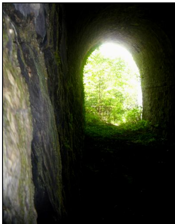
Photo de l'entrée prise à contre-jour, montrant bien l'ovalisation du tunnel et le bombé de la paroi droite imputables aux poussées du terrain

Un calvaire et deux arbres cachent le mur en parpaings bruts qui ferme la sortie du tunnel