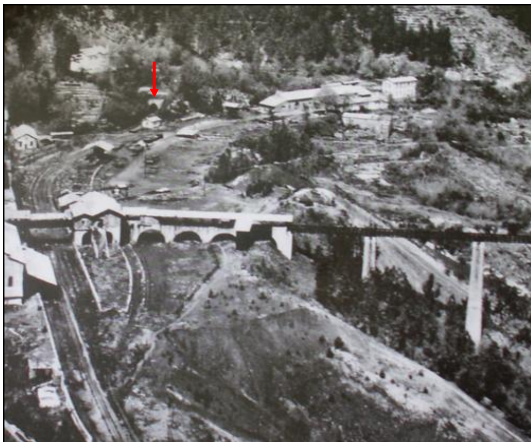
La gare de la Jasse avec, à droite, le viaduc et l'arrivée de la petite ligne minière de Cessous Cornas Flèche rouge : débouché du tunnel de la Jasse

Si cette fiche comporte des erreurs ou des oublis, merci de nous le signaler.