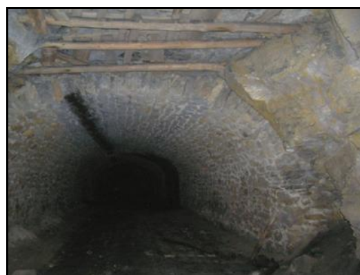
La galerie dans sa partie large à deux voies avec, au plafond, les traces résiduelles de suie des locomotives à vapeur