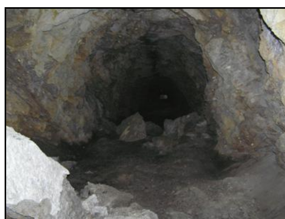
La partie de galerie à voie unique, taillée dans la roche vive avec quelques chutes de blocs