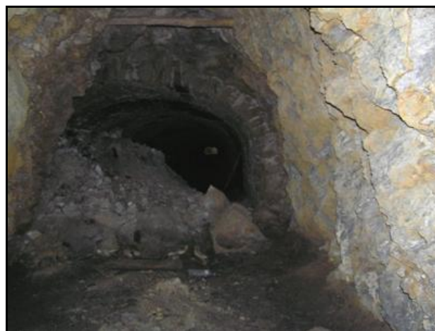
L'effondrement principal juste à l'endroit où la galerie se rétrécit et cesse d'être maçonnée