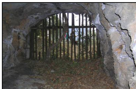
Ci-contre, la sortie vue de l'intérieur