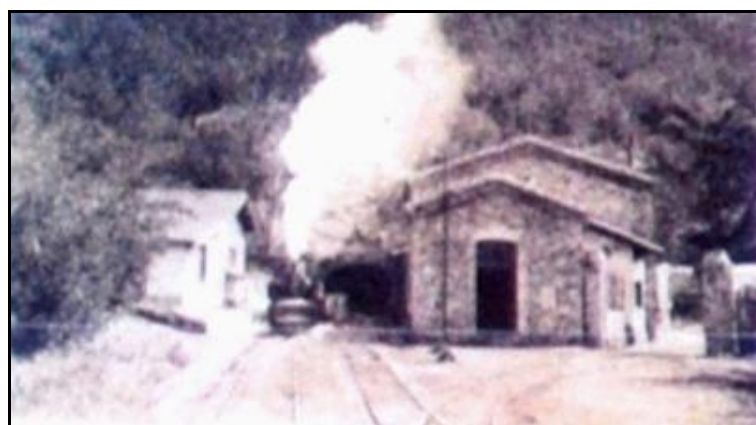
Ci-contre, photo ancienne de l'entrée à deux voies du tunnel de Palanquis du temps où il était en service