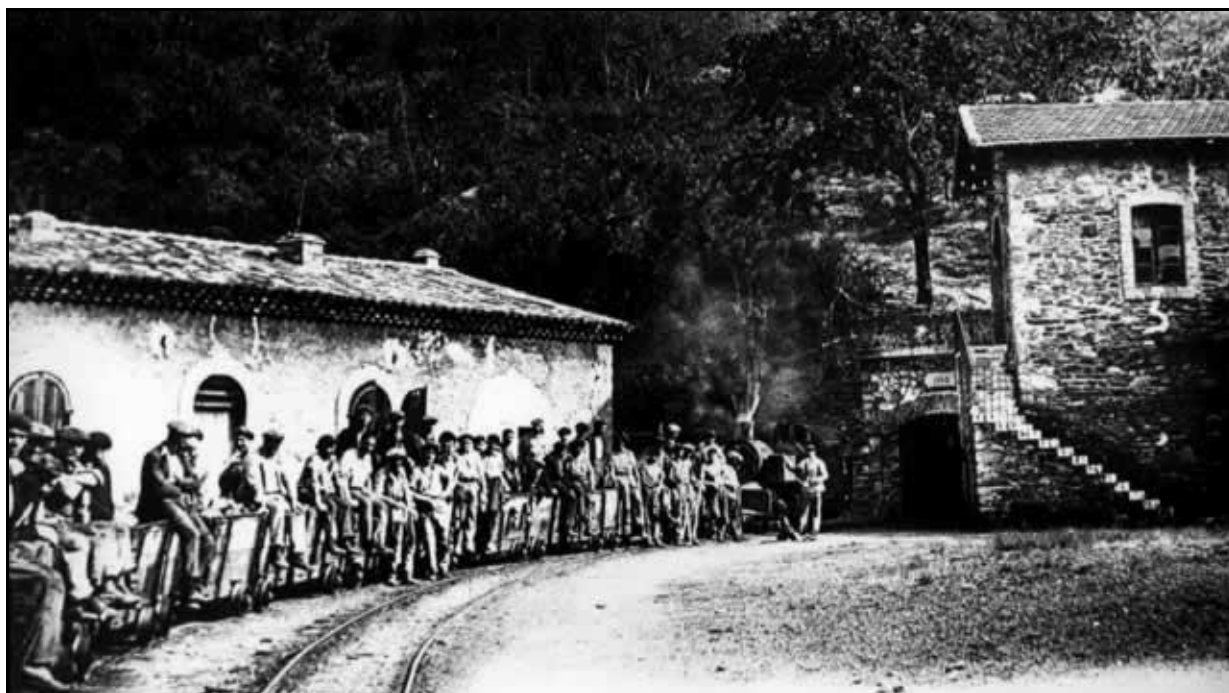
Train de mineurs sortant de la galerie de mine de Cessous

Si cette fiche comporte des erreurs ou des oublis, merci de nous le signaler.