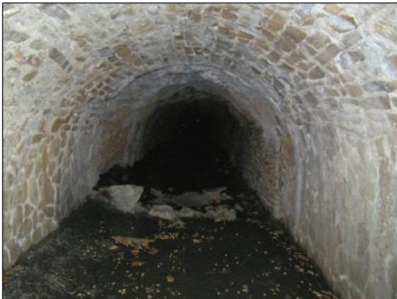
Ci-dessus et ci-dessous, la galerie du tunnel