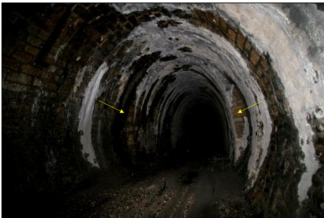
Ci-dessus et ci-dessous, changements de forme de la section interne dans la galerie et à la sortie