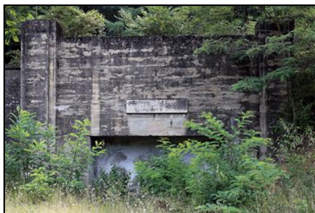
Et la sortie condamnée aujourd'hui