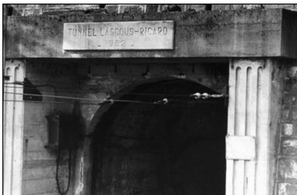
Détail de l'entrée