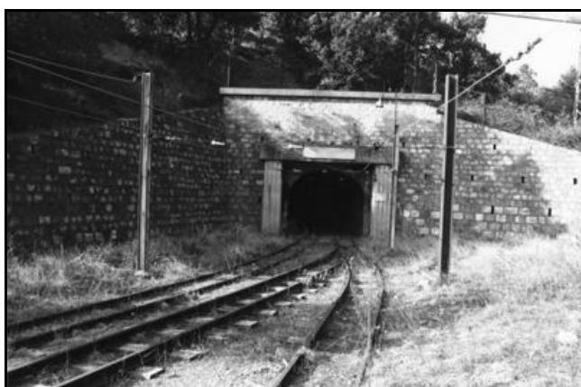
L'entrée à l'époque où la galerie était en service