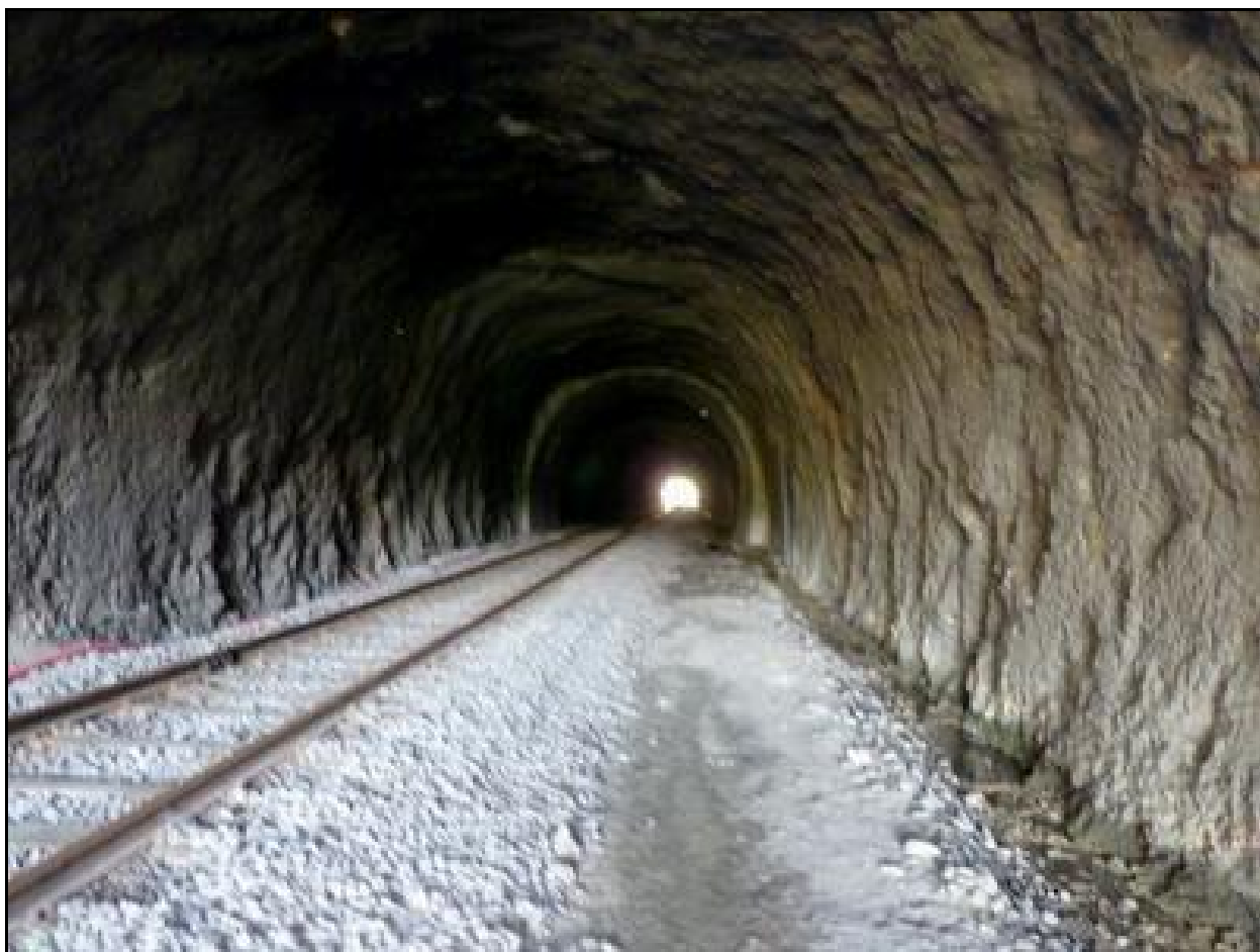
La belle galerie du tunnel de Saint Ambroix

Si cette fiche comporte des erreurs ou des oublis, merci de nous le signaler.