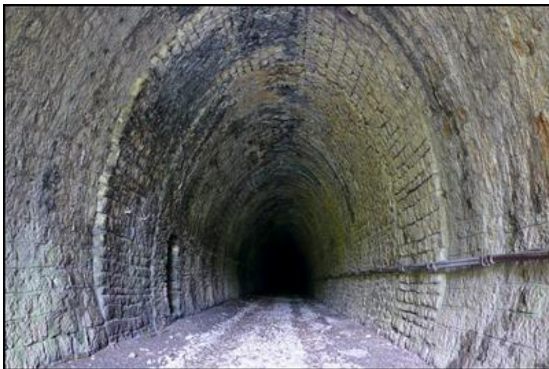
Dans la partie à peu près en bon état proche de l'entrée, noter les reprises de piédroits