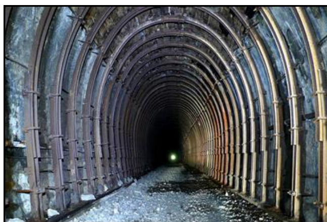
Ci-dessus et ci-dessous, divers aspects de la galerie cintrée