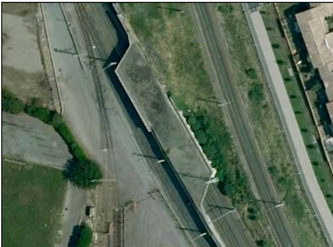
Gros plan montrant la galerie résiduelle sur la ligne Montauban > Toulouse et la partie disparue sur la voie de service à gauche

Si cette fiche comporte des erreurs ou des oublis, merci de nous le signaler.