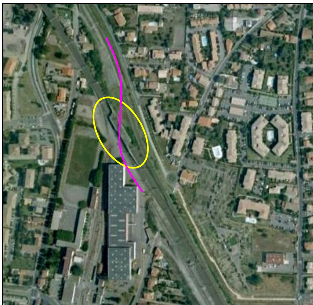
Photo aérienne montrant le saut de mouton abandonné (ellipse jaune) et le tracé de la voie de service qui aurait dû passer dessus