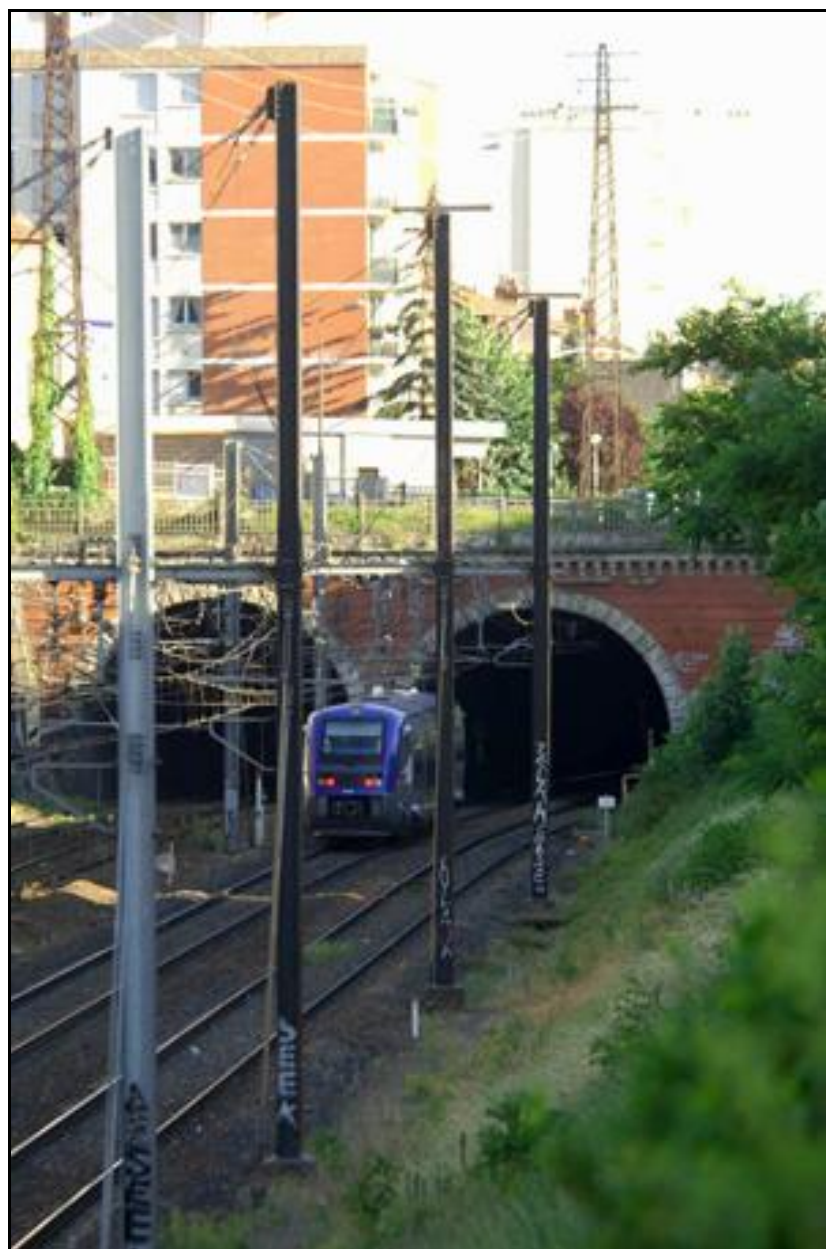
Ci-contre, les deux entrées des galeries de Guilleméry : A gauche, la galerie Est A droite, la galerie Ouest