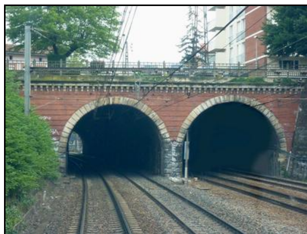
A gauche, galerie Ouest ; à droite, galerie Est