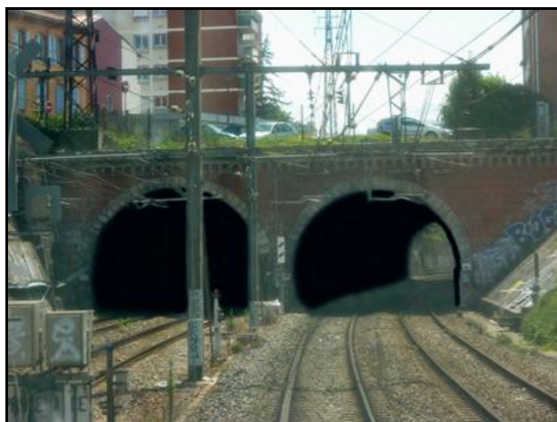
A gauche, galerie Est ; à droite galerie Ouest