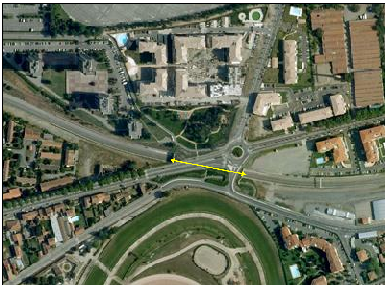
Vue aérienne du faux tunnel de la Cépière

Si cette fiche comporte des erreurs ou des oublis, merci de nous le signaler.