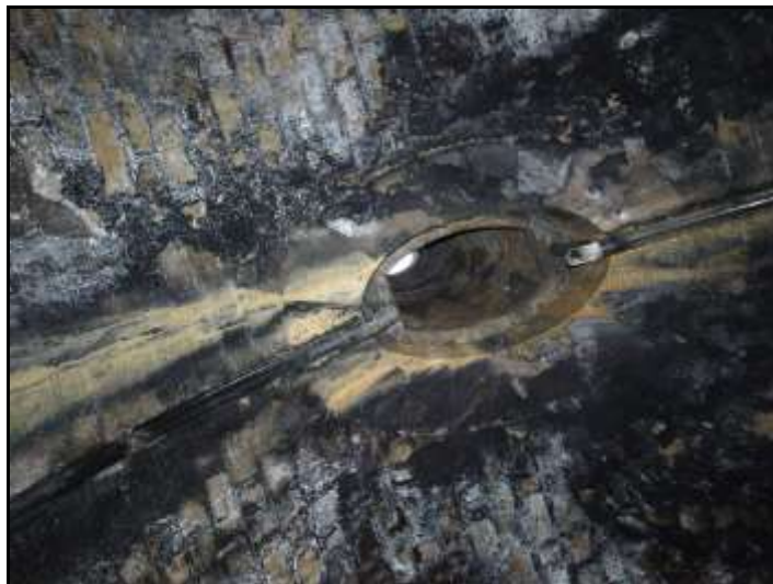
La deuxième cheminée :