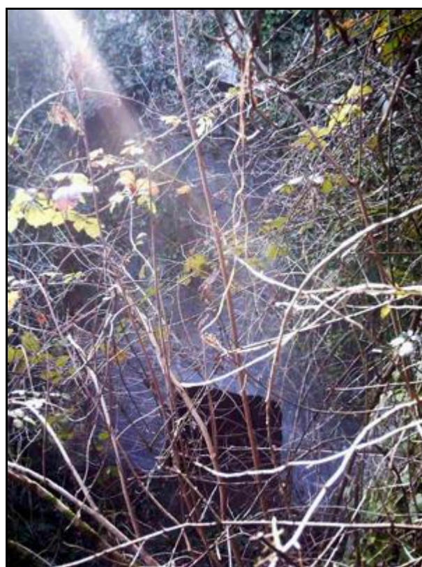
La sortie murée et sa porte